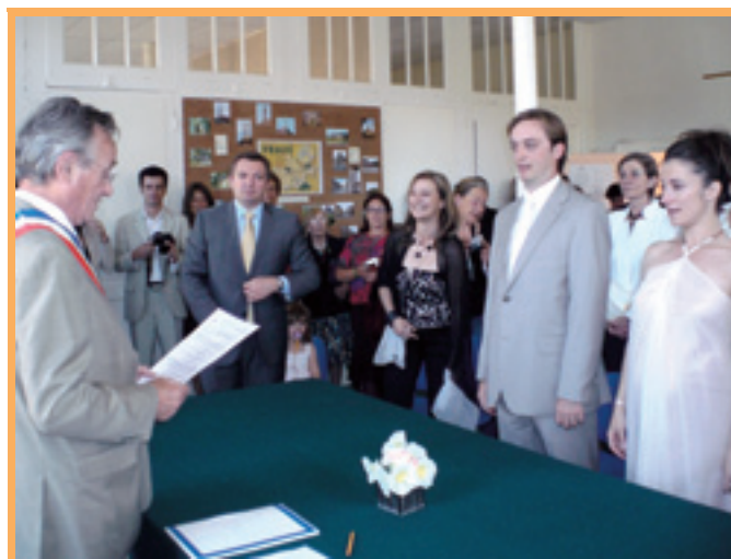
Le premier adjoint a marié sa fille.