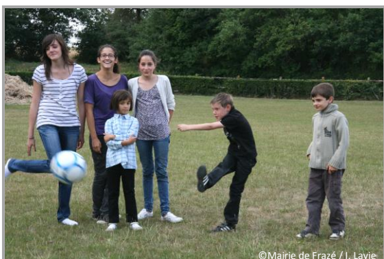
13 juillet – séance de tirs au but lors des jeux pour les enfants organisés par le Comité des Fêtes