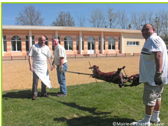
10 avril – méchoui de l'Amicale des Anciens Elèves