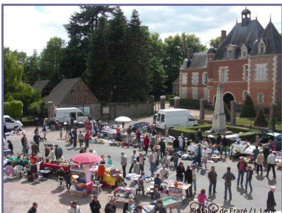
15 mai – brocante du Comité des Fêtes