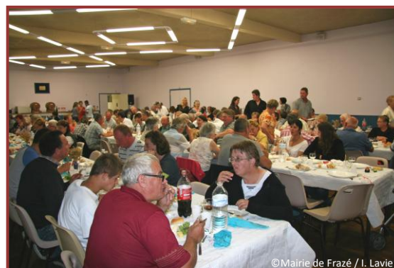
13 juillet – salle comble lors du buffet champêtre