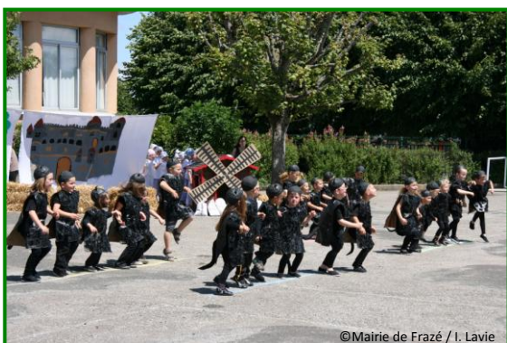
25 juin – fête de fin d'année à l'école de Chasant : un spectacle haut en couleurs sur le thème du Chat botté et de « Meunier tu dors »