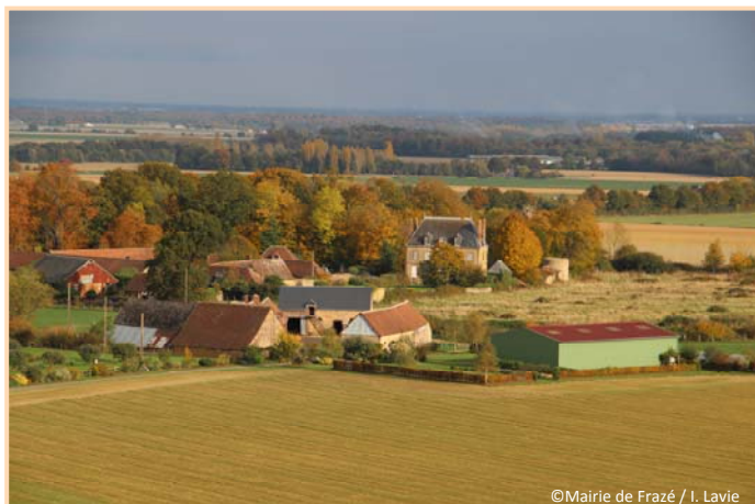
A l'Est : L'Orme et son château