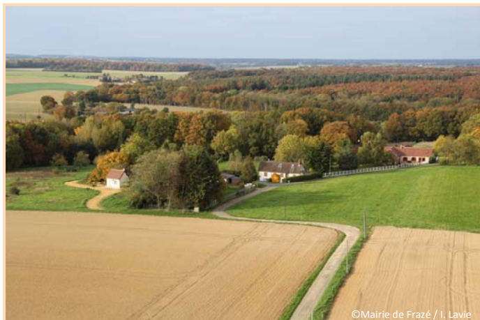
Au Nord : Les Phayes et les bois de Montigny