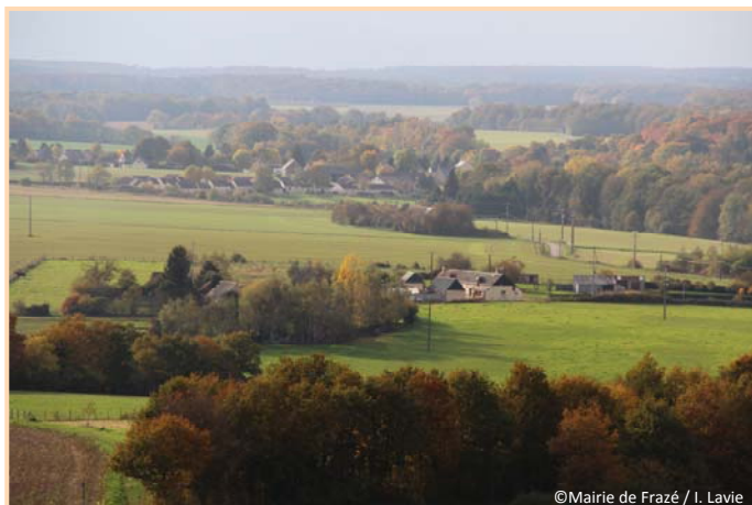
A l'Ouest : Les Ouelles et le bourg de Frazé

Le second chantier de grande envergure commence à peine et devrait durer plusieurs mois. Il s'agit du raccordement de plusieurs hameaux de Frazé au réseau d'eau de Frazé-Mottereau : Le But, Les Mabillières, La Pacotterie, Le Grand Carcahut, Aigrefoin, Le Petit Carcahut, Les Marchais et Le Cormier.