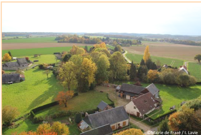
Au Sud : le Boulay et La Girouardière