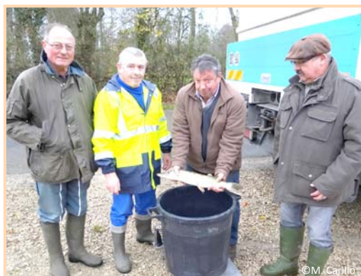
2 décembre – plus de 300 kg de poissons déversés dans l'étang par la Gaule Frazéenne