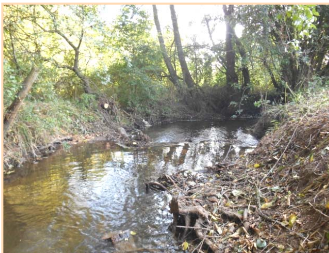
Après travaux : berges dégagées, permettant le bon fonctionnement de la rivière.

Contact : SMAR Loir 28 – Mairie de Bonneval – 19 rue Saint Roch 28 800 BONNEVAL – 02.37.45.84.51 / 06.47.08.34.62 Mail : responsablestructure@smar-loir28.fr – Site Internet : www.smar-loir28.fr