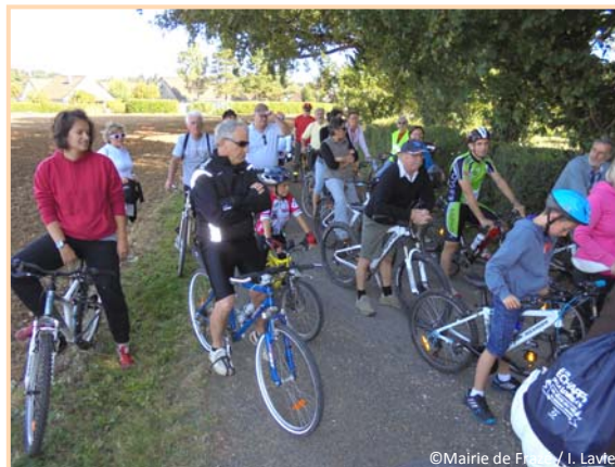
31 août – Randonnée des Echappées de la Loire à Vélo avec une trentaine de cyclistes