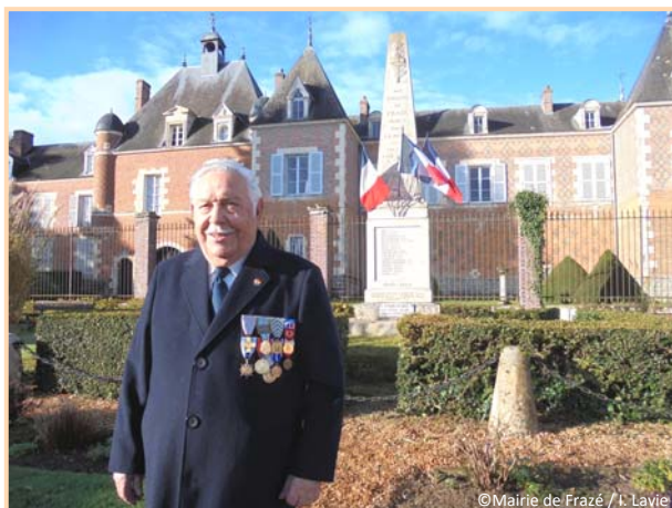
... et devant le monument aux morts de Frazé le 11 novembre 2014