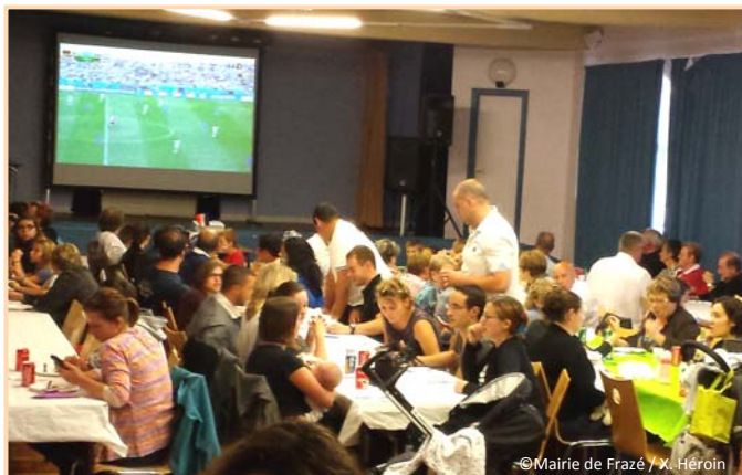
13 juillet – Retransmission de la finale de la Coupe du Monde de football à la salle des fêtes