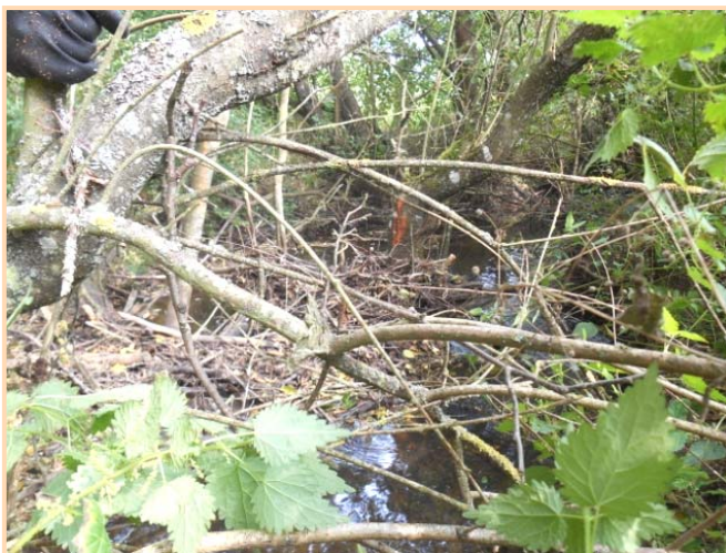
Avant travaux : présence d'embâcles gênant le bon écoulement de l'eau.

Ces travaux consistent à retirer les embâcles (arbres tombés dans la rivière), abattre ou recéper les arbres vieillissants et/ou déstabilisés, élaguer les branches basses. Le bois coupé est valorisé en bois de chauffage (bille de 1 m).